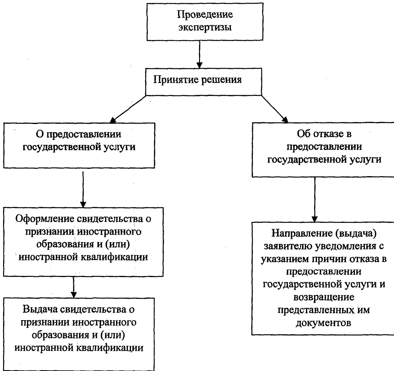
"Блок-схема последовательности действий предоставления государственной услуги (Б)"